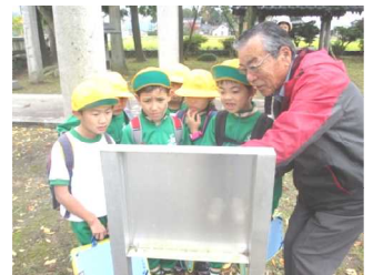
〈2年地区探検(住吉神社)より〉

一人では感じることでできない学びがいを、人と関わることで子供たちは多く感じているのでしょう。学校や家庭、地域が連携して、これからも子供たちをよりよい学びに導いていきたいと思えます。